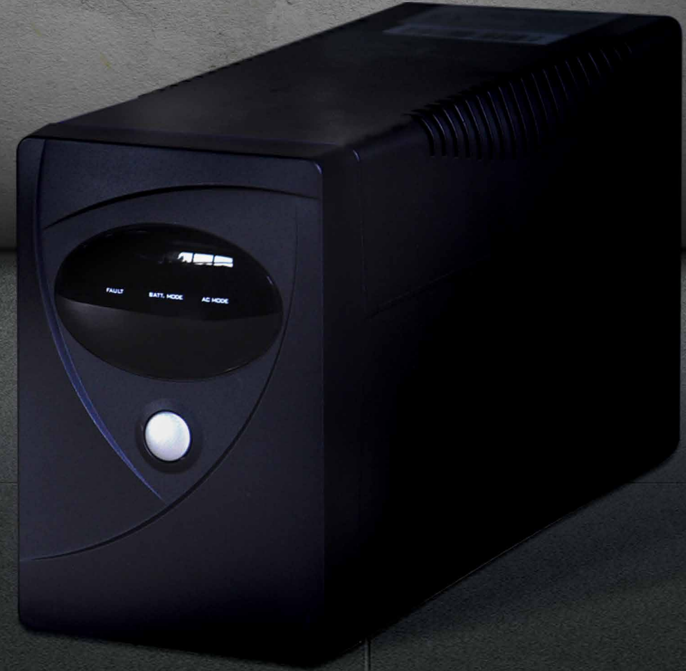
Dalton Serisi Line İnteraktif Ups 650-1000-1400-2000